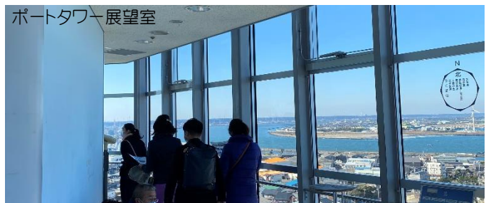
ポートタワー展望室

※記載の情報につきましては、コロナウイルスの感染状況や天候状況等により変更となる場合があります。